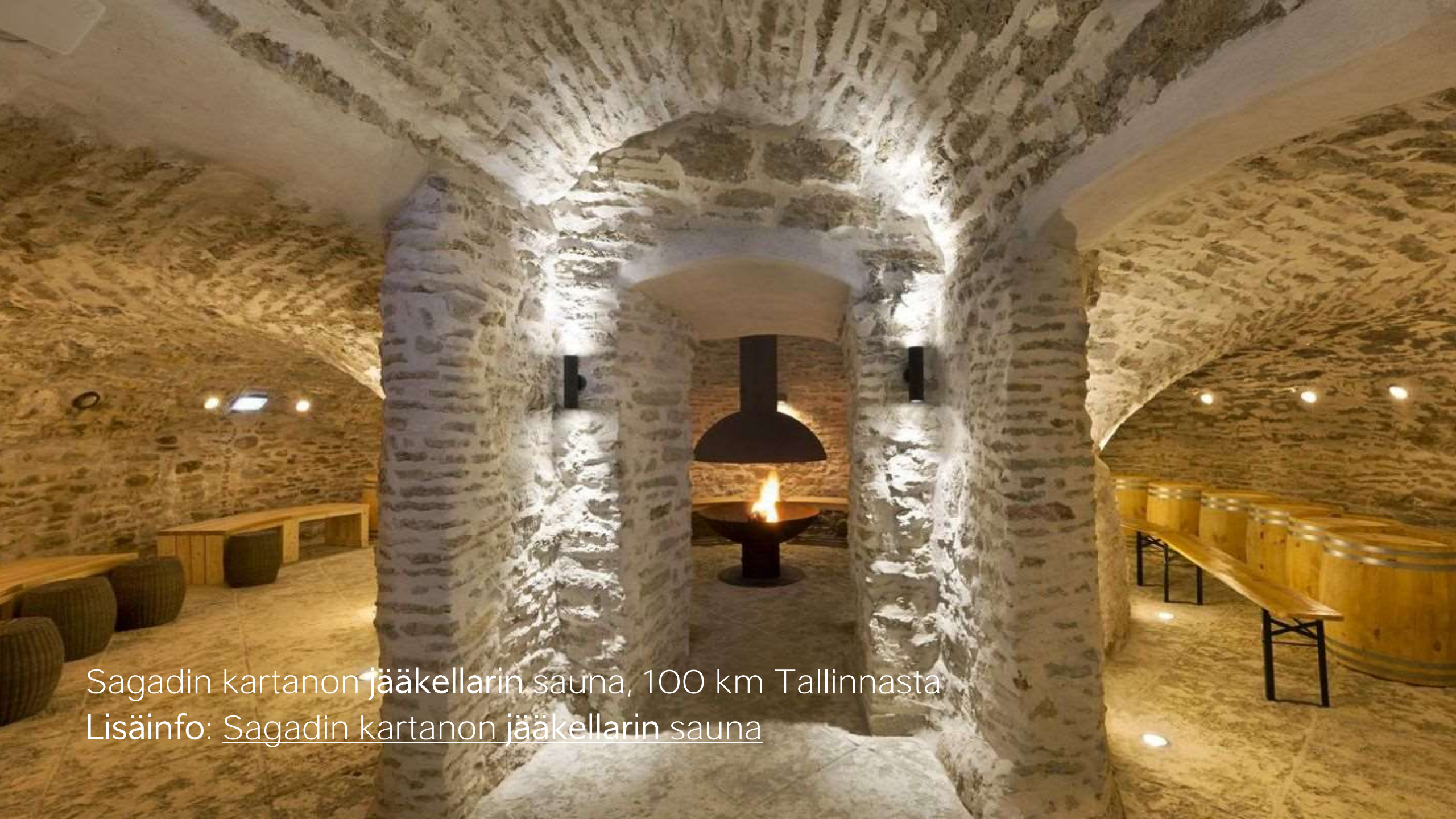
Sagadin kartanon jääkellarin sauna, 100 km Tallinnasta Lisäinfo: Sagadin kartanon jääkellarin sauna