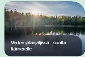
Veden jalanjäljissä - suolta Itämerelle