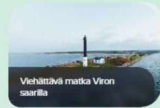
Viehättävä matka Viron saarilla