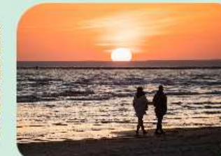
Löydä Pärnumaan rannikon piilevät helmet