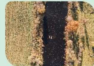
Soomaan kierros — tutustu luontoon, maaseutuelämään ja aitoihin elämyksiin