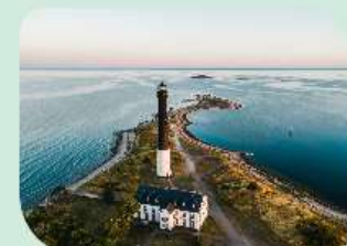
Majakkakierros Viron suurimmilla saarilla