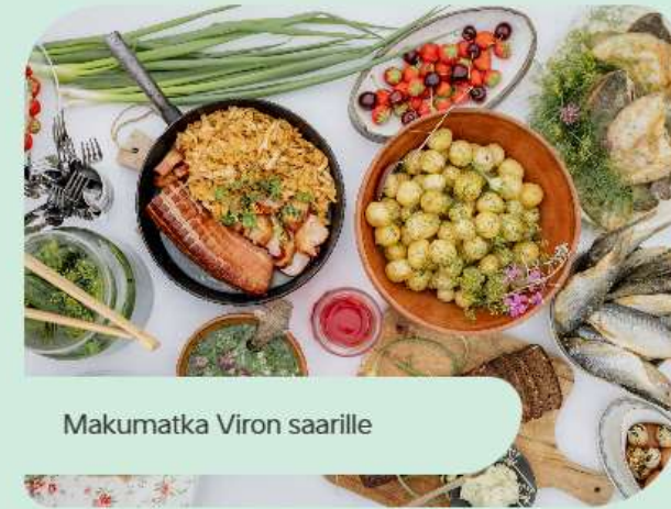
Makumatka Viron saarille

Rannikon rauhaa, saariston tarinoita ja hyvinvointia