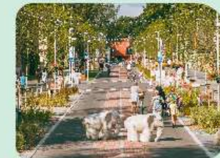
Pärnun kylpylänsorsu suosittelee